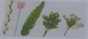
Схема создания композиции: